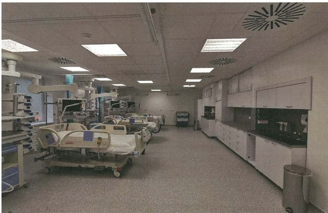
Foto č. 4 - Rekonštrukcia a modernizácia OAIM-ARO Ľubovnianskej nemocnice n.o.