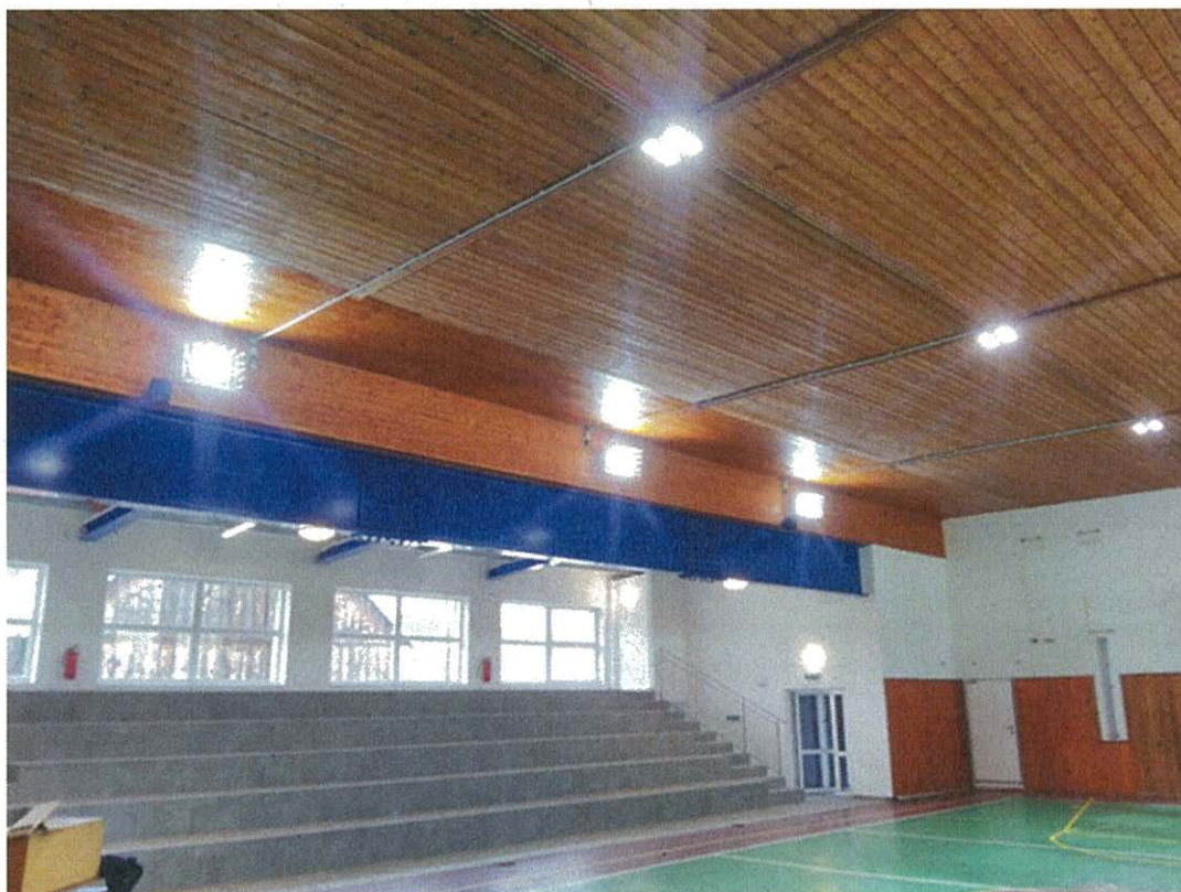
Foto č. 1 - Rekonštrukcia telocvične ZŠ v obci Kamienka