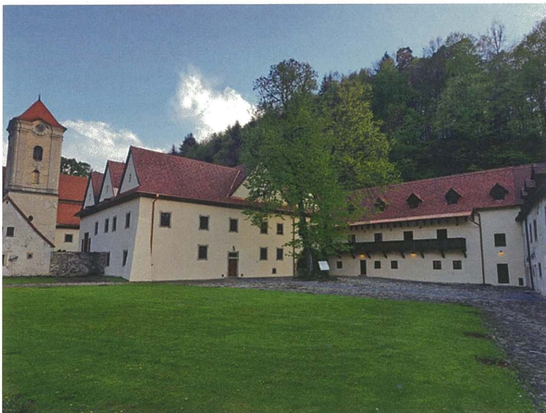
Foto č. 5 – Stavebná obnova exteriérov objektov E & F NKP Kláštor kartuziánov v Červenom Kláštore