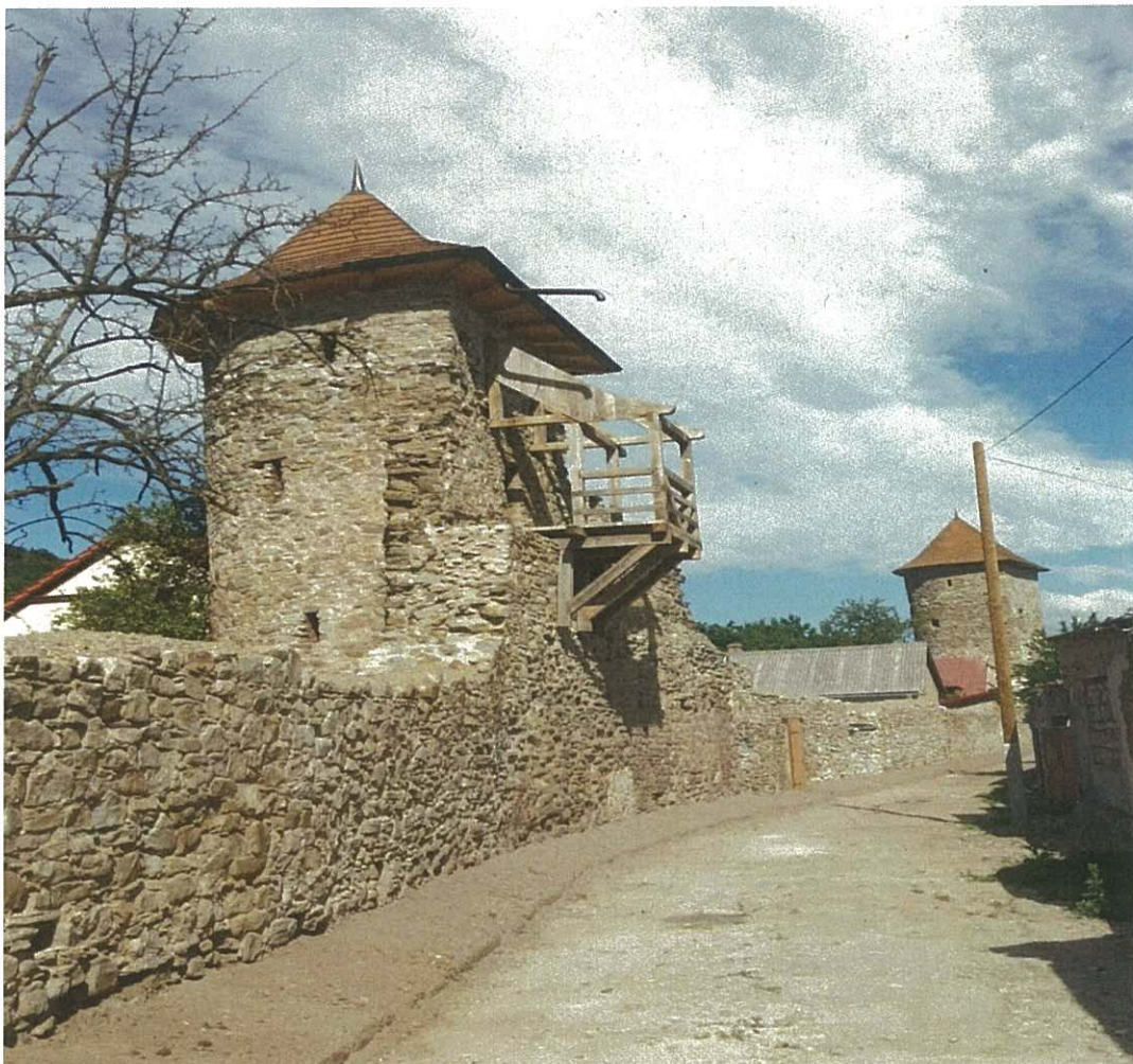
Foto č. 2 - Obnova mestského opevnenia v Sabinove